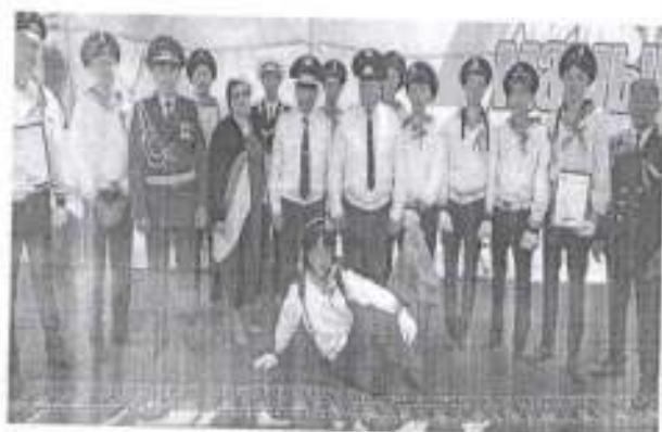
9 мамыр Жеңіс күні қарсаңында жеңіс лентасы акциясы өтті.